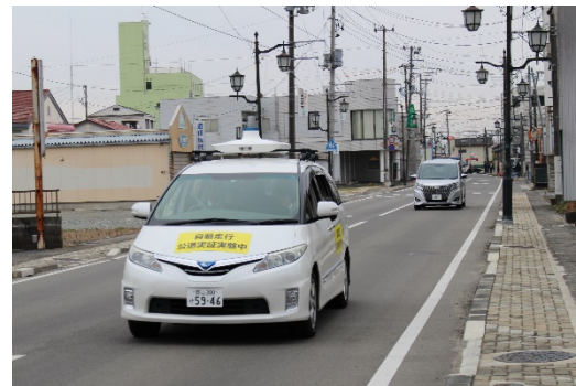
公道での自動走行の様子

本実証試験は、今後も毎週火曜日、第一木曜日、第三木曜日の14:00~16:00の間、最大2往復程度の運行を実施予定です。「自動化」に向けた取り組みのため、道路交通法に基づき、運転席にドライバーが座り、必要な安全対策を行いながらの走行となります。車体には「自動走行 公道実証試験中」の表示を行います。